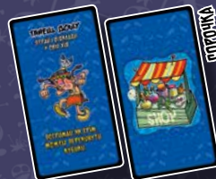
13 КАРТ АРТЕФАКТІВ