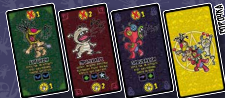
36 КАРТ ПРОКЛЯТЬ 12 КЕЛЬТСЬКИХ, 12 ЄГИПЕТСЬКИХ, 12 ГАЙТАНСЬКИХ