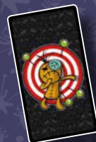
1 КАРТА ЦІЛІ