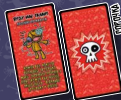
10 КАРТ ПОСТІЙНИХ ПРОКЛЯТЬ