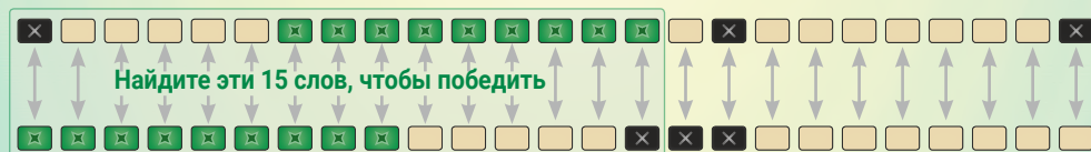
КАК ВИДИТЕ ЦВЕТА ВЫ

Из 9 слов, которые окрашены в зеленый цвет с вашей стороны карточки, 3 слова также окрашены зеленым на другой стороне. Это означает, что вместе вам необходимо найти всего 15 зеленых слов. Совет: некоторые игроки предпочитают класть карточки агентов по направлению к напарнику, чтобы в ходе игры можно было отследить, кто какие слова отгадал.